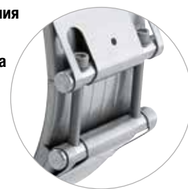
Соединитель NORMACONNECT® FLEX 3 имеет увеличенную ширину ленты 211 мм